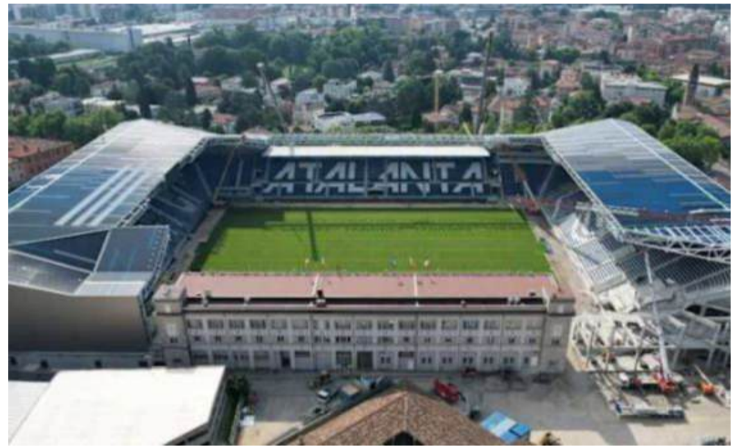
PRONTO - Due immagini del Gewiss Stadium