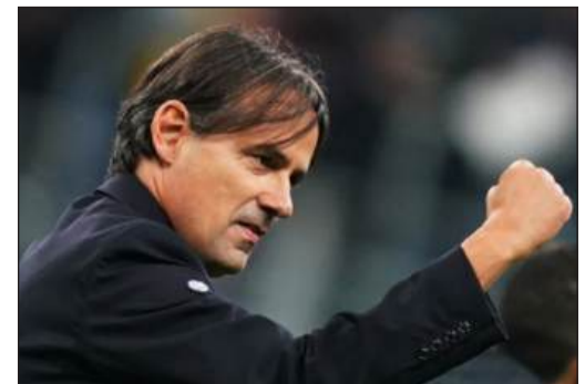
La grinta di Simona Inzaghi