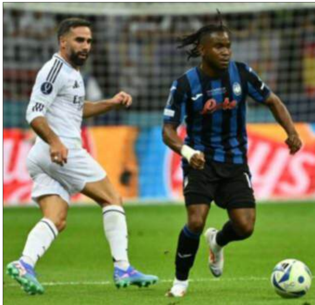
FUORICLASSE ATALANTINO - Ademola Lookman, qui in azione contro il Real Madrid

SERIE A I nerazzurri di Gasperini alle 15 contro una Fiorentina alla ricerca dell'assetto migliore