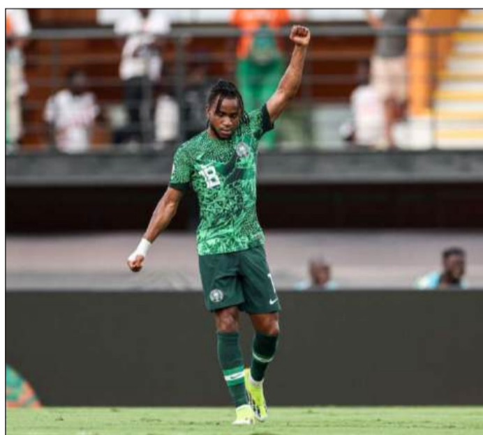
STELLA DELLA NIGERIA - Lookman