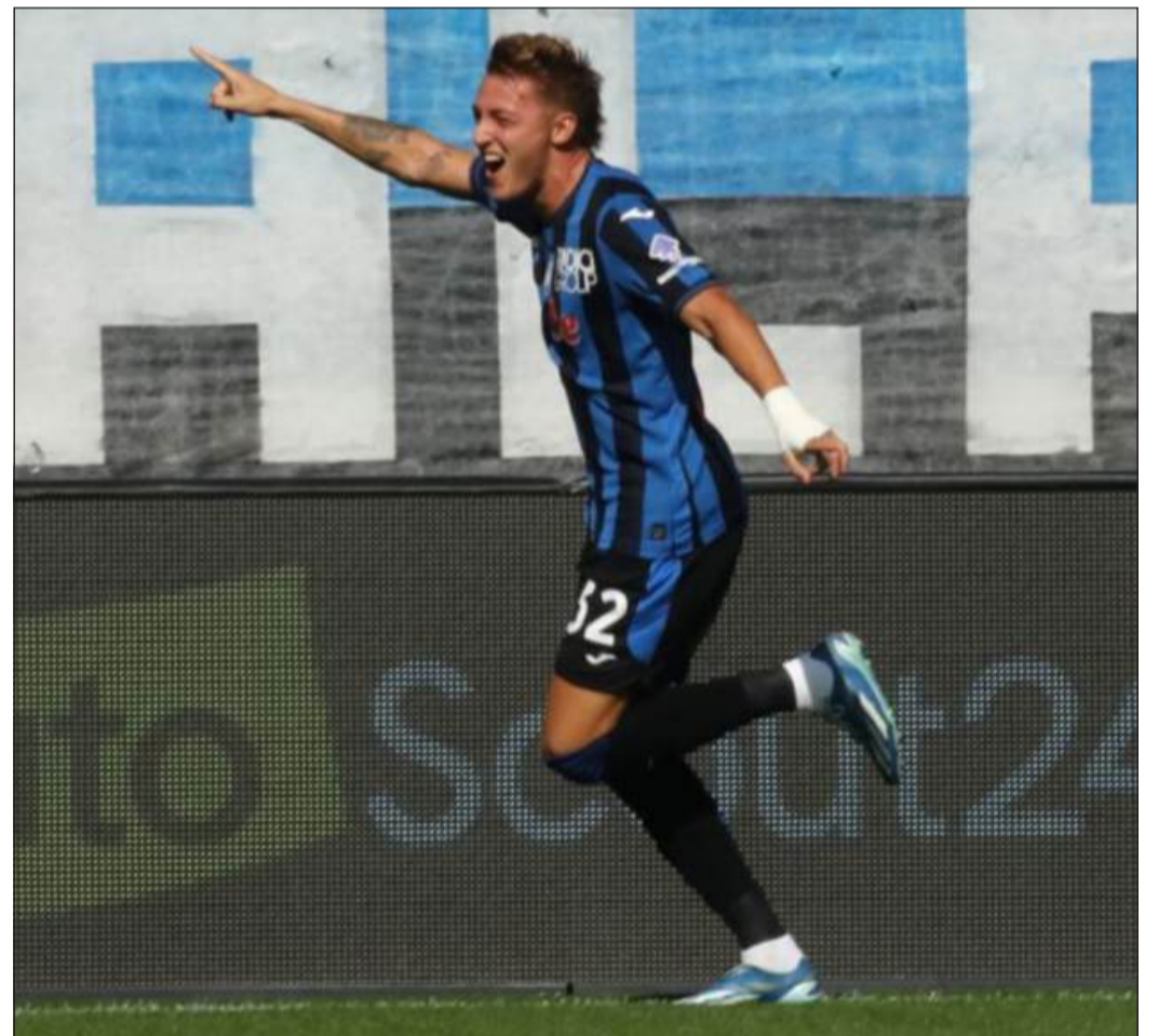
IL NUOVO BOMBER NERAZZURRO - Mateo Retegui, 25 anni