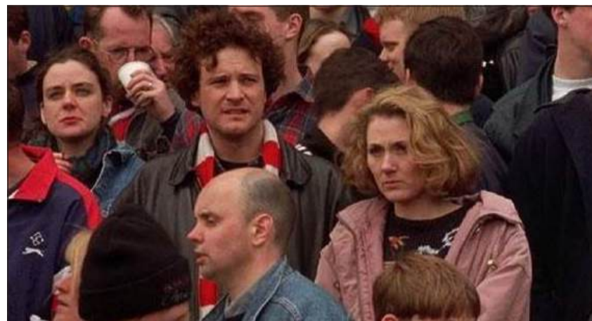
FILM CULT - Due immagini di "Febbre a 90", pellicola del 1997