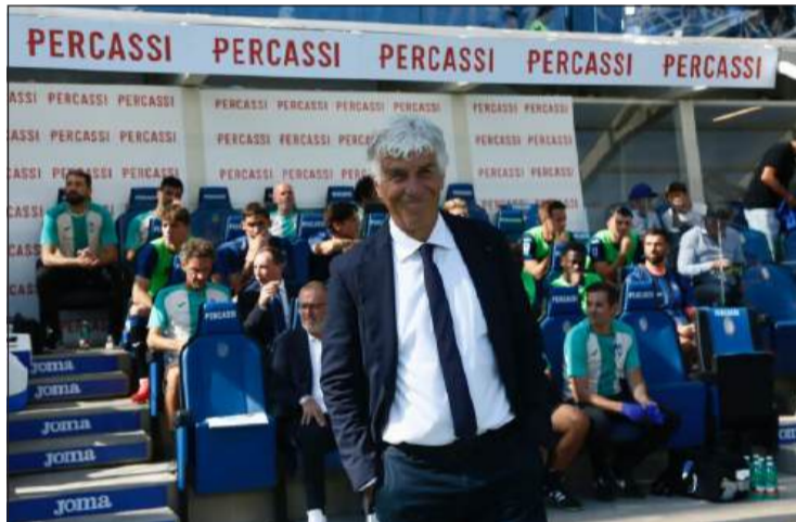
TIMONIERE - L'allenatore dell'Atalanta Gianpiero Gasperini

L'OBIETTIVO DEL GASP – “L'obiettivo più difficile è cercare di star dentro nelle prime otto, quello più realistico di posizionarci dal nono al ventiquattresimo posto per poter spareggiare per gli ottavi di finale – continua il