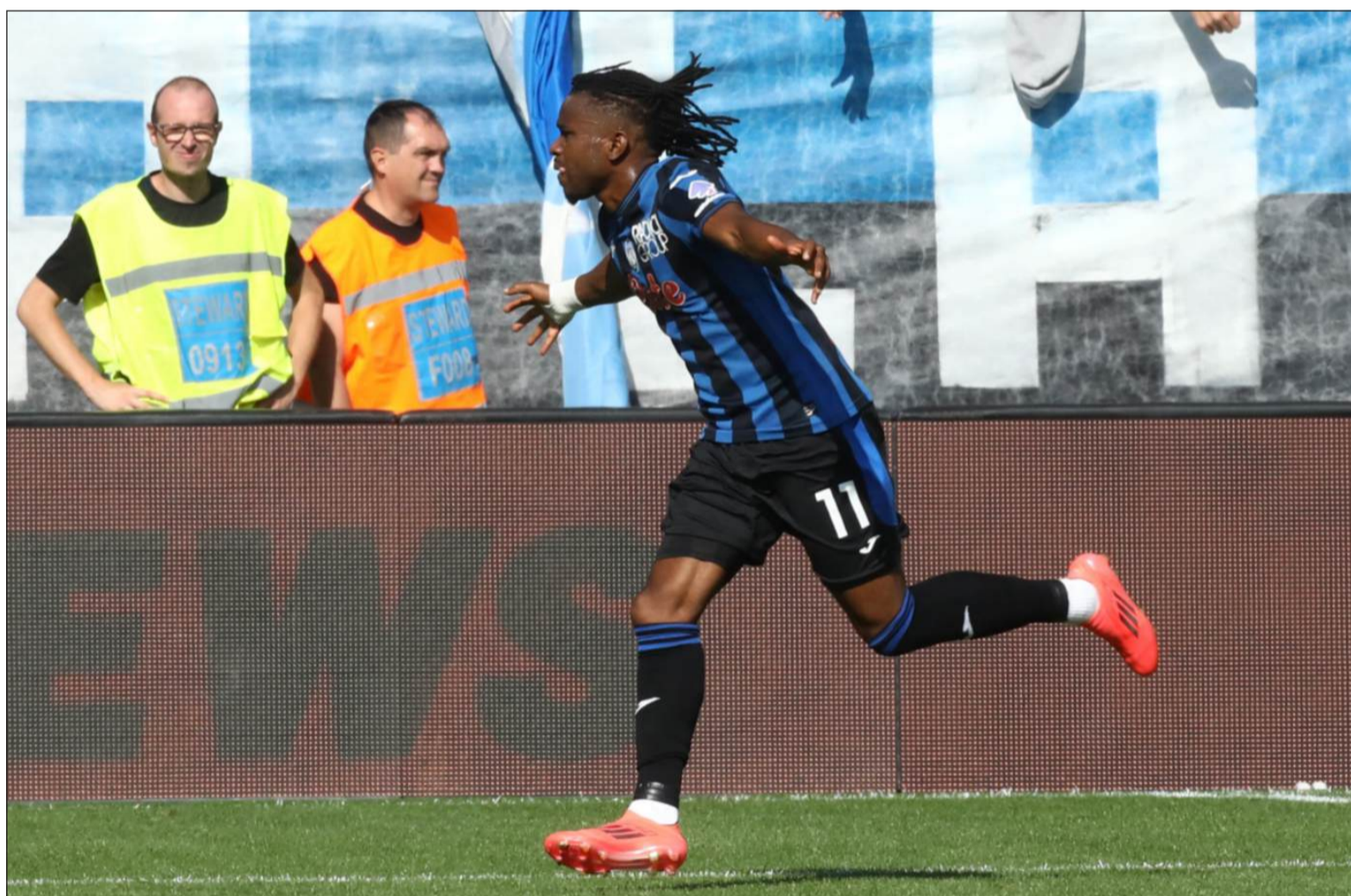
IL PIU' ATTESO - Ademola Lookman, 33 gol nell'Atalanta e 66 totali in carriera