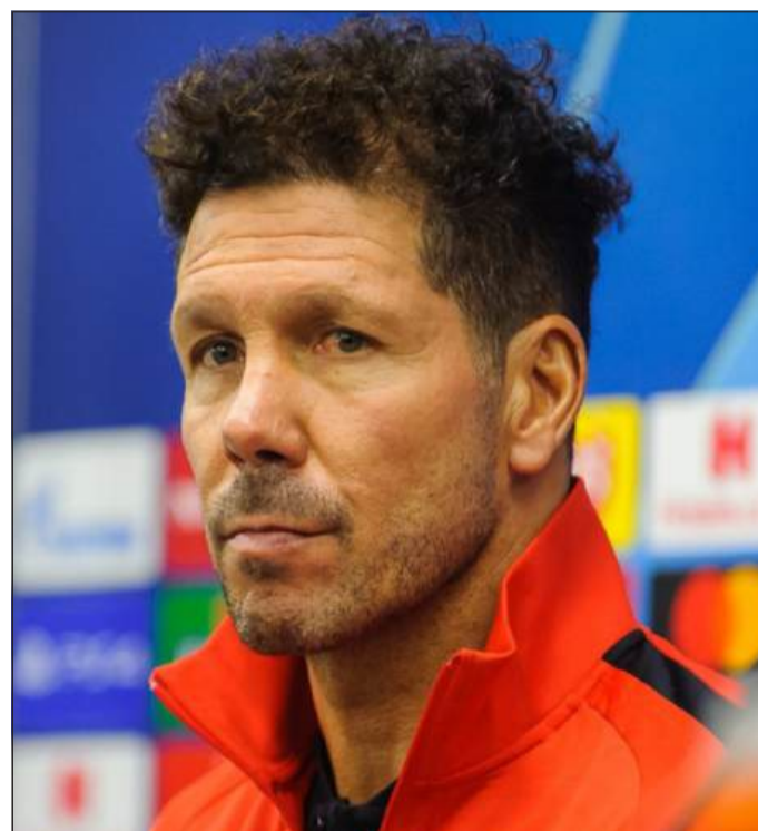
IL CHOLO - Diego Simeone, allenatore dell'Atletico

nuti che promettono spettacolo, divertimento e gol. Seconda tedesca impegnata in serata, o meglio nel tardo pomeriggio, anticipo delle 18:45, è proprio il Bayer Leverkusen, ospite del Feyenoord. Dopo la storica cavalcata dello scorso anno in campionato e la finale di Europa League, dissipata sotto i colpi di Lookman e della magica Dea, la banda di Xabi Alonso si affaccia all'Europa che conta. Il perfetto meccanismo dell'ex centrocampista di Liverpool, Real e Bayern punta a stupire anche tra i grandi, con l'obiettivo di sfondare il muro degli ottavi di finale, che in tutti gli anni 2000 ha rappresentato un ostacolo insormontabile, eccezion fatta per la memorabile finale della stagione 2001/02 con il Real Madrid, passata alla storia per la prodezza al volo di Zinedine Zidane. Anche in questo caso, pronti e via, l'esordio è subito tosto, come d'altronde si prospetta ogni singola gara di questo nuovo formato, nella bolgia infernale di Rotterdam. Gli olandesi hanno una rosa sicuramente più modesta ma chissà che una grande prestazione collettiva, spinta poi dal solito caldissimo tifo non possa regalare già una sorpresa.