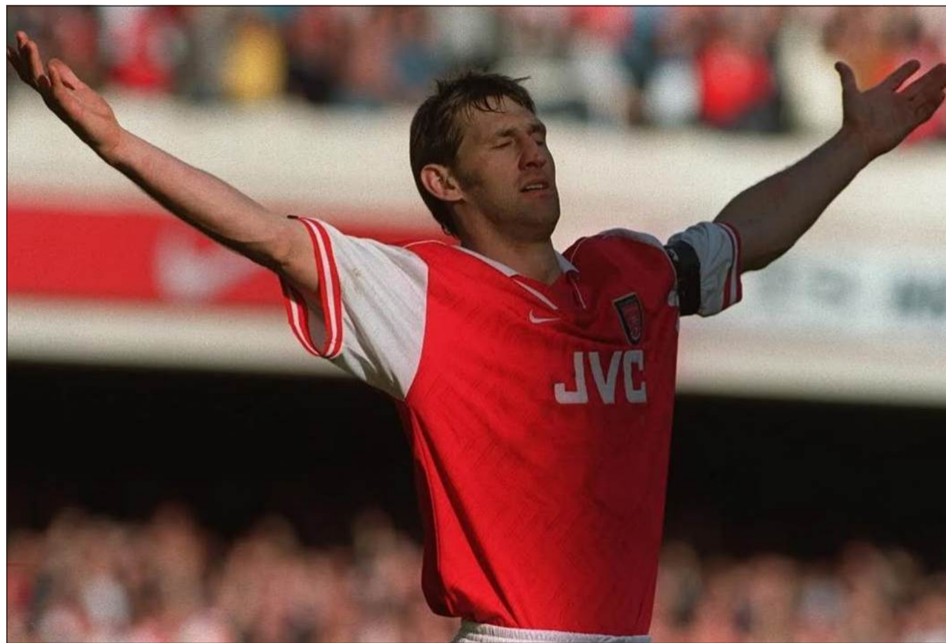
STORICO CAPITANO - Tony Adams, difensore centrale dei Gunners negli anni Ottanta e Novanta

Eppure l'Arsenal, per il suo fascino mitologico, è di gran lunga la squadra inglese più ti-