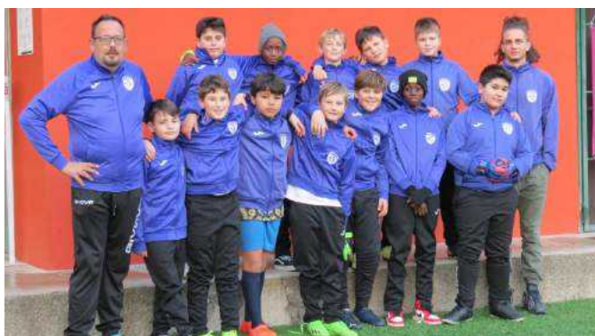
Gli Esordienti a 7