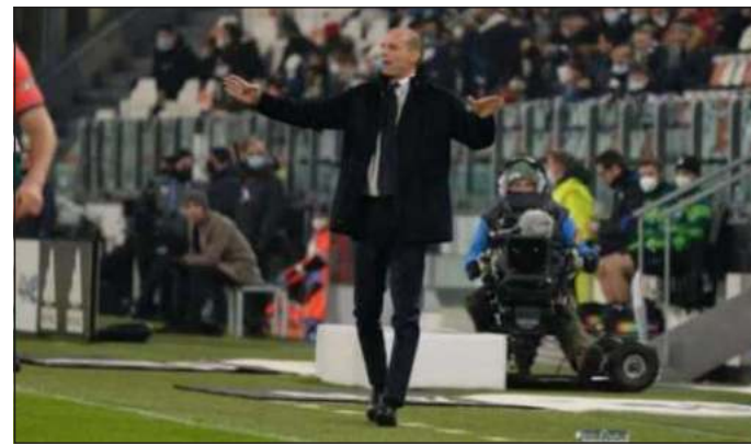
MDC Allegri, allenatore della Juventus

vittoria contro il Lecce, il progetto Europa è tutt'altro che campato per aria. A 36 punti, invece, continua a brillare il Bologna di Thiago Motta. I felsinei vivono un momento di grande salute e forte convinzione, riuscendo - in tempi non sospetti - a battere persino l'Inter e a bloccare sul pari la Lazio. Morale della favola, per l'Atalanta non sono ammessi ulteriori errori. Urge battere l'Empoli per ritrovare punti, ossigeno e morale. Fattori imprescindibili in una pazzesca corsa all'Europa che non ammette passaggi a vuoto.