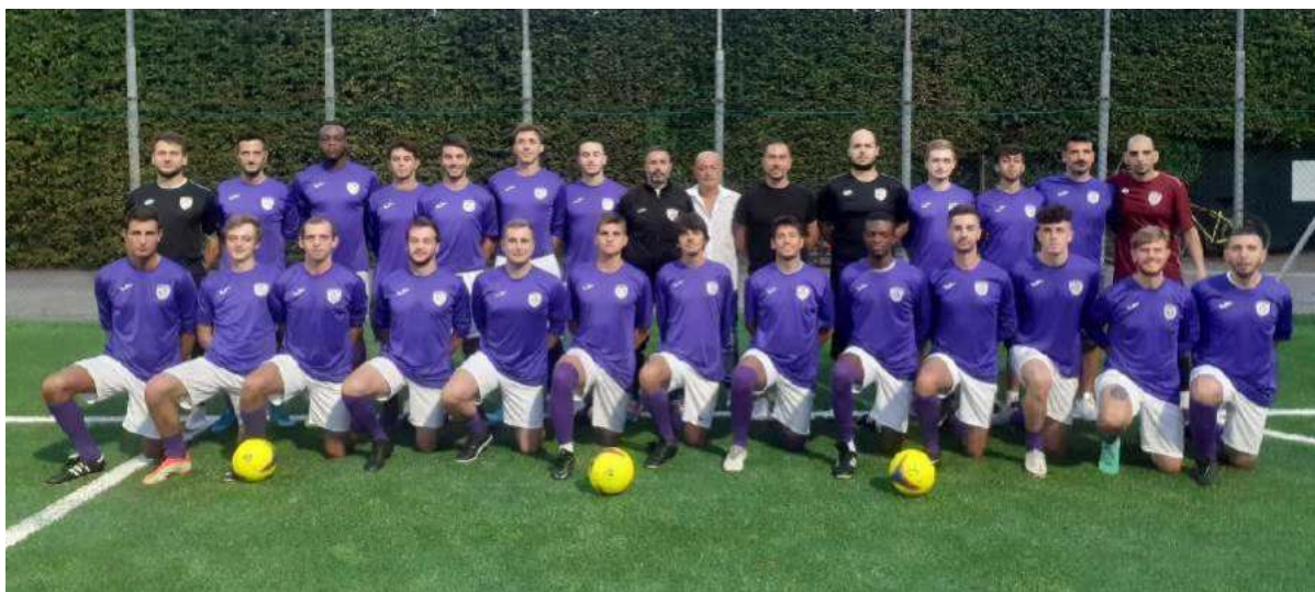
La prima squadra della Virescit