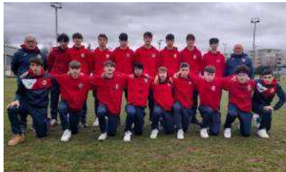
Gli Under 17 2006