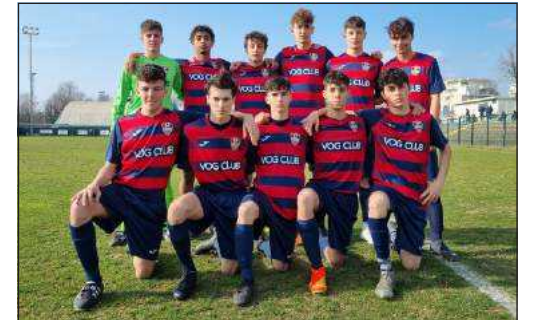
La formazione Juniores