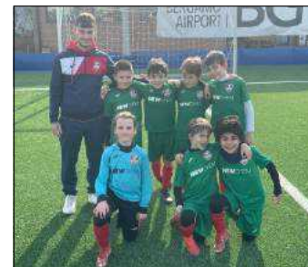
Qui e in basso a sinistra (nelle prime due foto) i 2014/2015