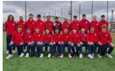
Gli Under 16 2007