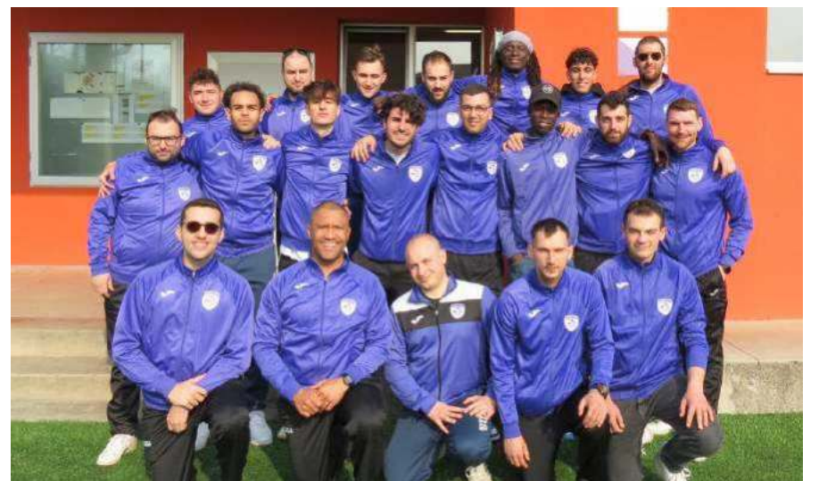
I Dilettanti a 11