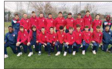
Gli Under 15 2008