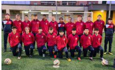
Gli Under 18 2005