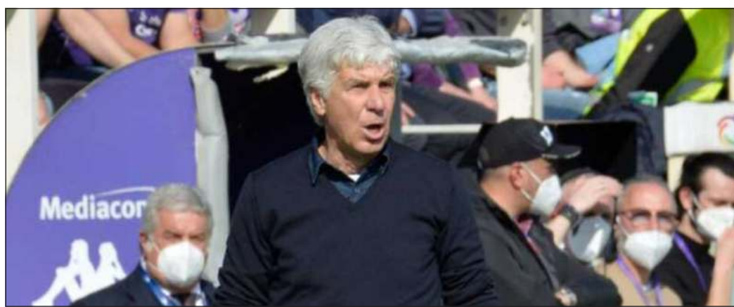
Mister Gian Piero Gasperini

LA BORDATA "Noi affrontiamo squadre che hanno un miliardo di debito, il fatto di essere lì ci rende soddisfatti"