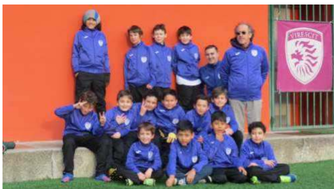
I Pulcini a 7