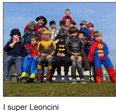
I super Leoncini