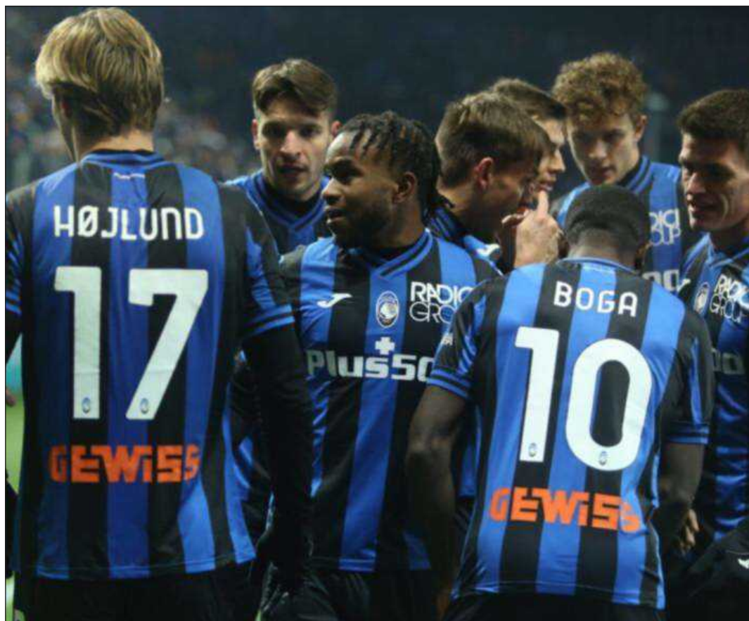
Anticipo al venerdì per l'Atalanta che ospita l'Empoli di Zanetti. I nerazzurri cercano una vittoria per rilanciarsi in chiave europea. Anche i toscani non vivono un gran momento di forma: tre pareggi e tre sconfitte nelle ultime sei uscite