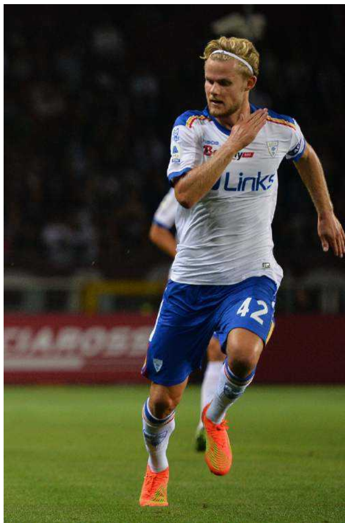
Hjulmand del Lecce

nazionali De Roen, che compie 32 anni tra un mese, e Koopmeiners, ma anche per avere un sostituto di quest'ultimo se il numero 7 nerazzurro