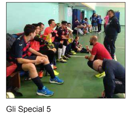
Gli Special 5