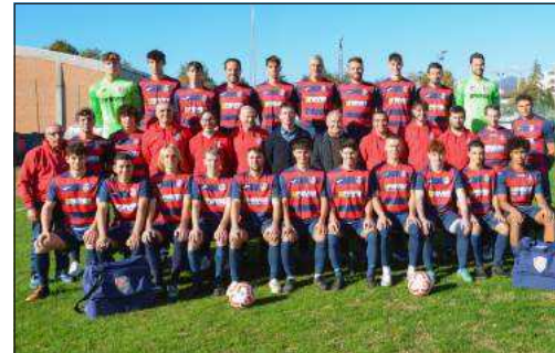
La Prima Squadra