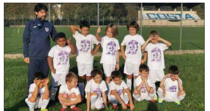
La Scuola Calcio