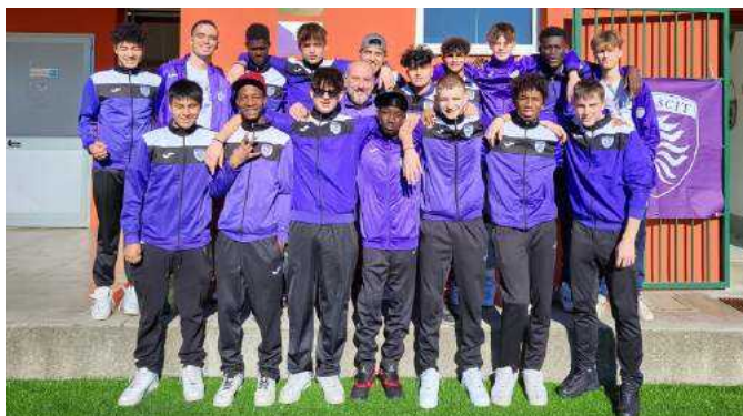
La formazione Juniores